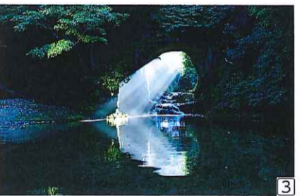
①潮干狩りを満喫! ②「漁師料理かなや」での昼食 ③人気のパワースポット「濃溝の滝」(写真はイメージです)

その他 この旅行はケイエム観光バス(株)【東京都知事登録旅行業第2-7180号総合旅行業務取扱管理者 佐々木茂】と参加者個人との契約で行われます。【利用バス会社:ケイエム観光バス】