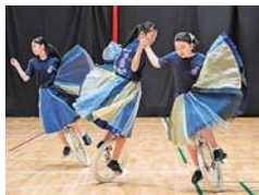
曲に合わせて演技の練習

輪車のバランス感覚を生かした躍動感あふれる回転や、アクロバットなどさまざまな要素が含まれます。その演技に込められたストーリーや感情を、見ている人に伝える芸術的な競技なのです!