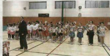
バトン・チア大会の様子

☎☎3889-8552 📧adachi.b.c.r.2016@gmail.com