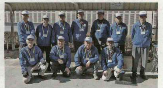
この仕事に誇りを持って仕事をしている会員の皆さん=アリオ西新井店で