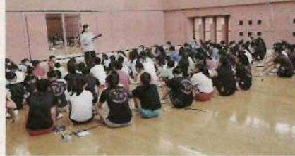
現在も第一線で子どもたちの指導に尽力しています

40年間指導に当たり、上海万博や東京マラソンなどの大きなイベントへ参加できるまでに団体を発展させてきました。