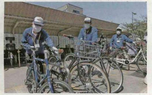
自転車の整理にあたる会員さん=同

2021年4月1日より「六町ローンプラザ」が『六町地域応援相談プラザ』に生まれ変わりました!!