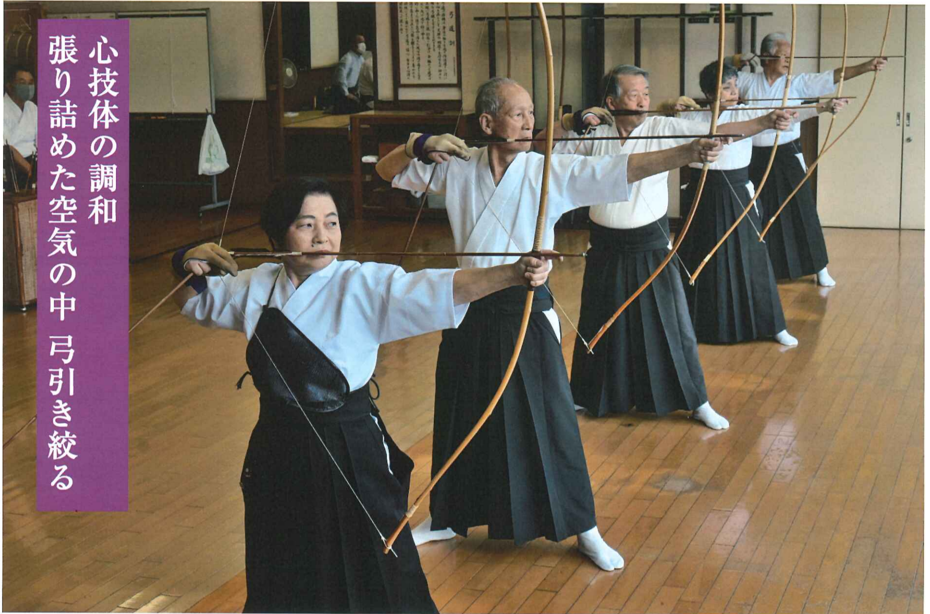
28m先の的に向かって、精神を統一し弓を引く弓道連盟の皆さん =千住緑町2丁目の千住スポーツ公園弓道場で