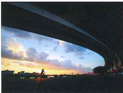
同準グランプリ「明日は晴れかな」