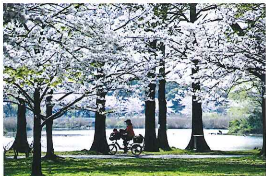
第3回グランプリ「桜と自転車」

問い合わせ (一財)足立区観光交流協会 ☎3880-5853 ☎3880-5769